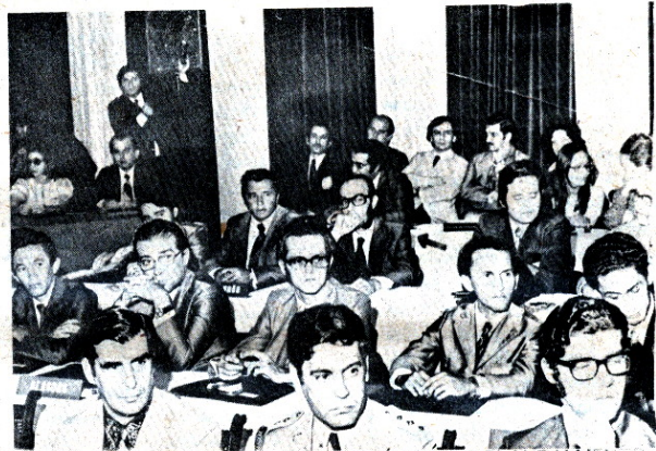
V ENCONTRO NACIONAL DE SECRETÁRIOS DE PLANEJAMENTO

Teatro: ROSAMONDE ou O TOURO DA MORTE (inédito)