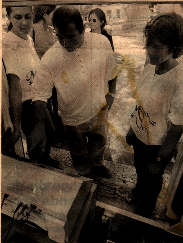
População vota na urna eletrônica instalada na João Lisboa

Cidades como Imperatriz, Santa Inês, Codó e Caxias também terão urnas à disposição da população para a escolha da per-