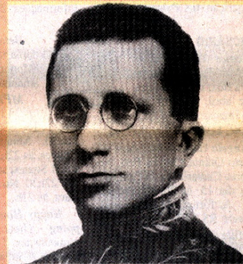
Humberto de Campos