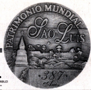
BANDEIRA TRIBUZI Lançamento a São Luís

ESPECIAL - O IMPARCIAL QUARTA-FEIRA, 8 DE SETEMBRO DE 1999