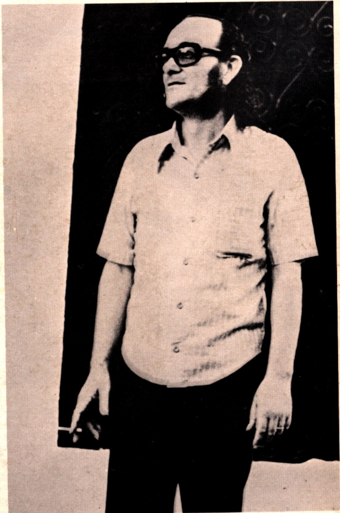
São Luís, 1977.