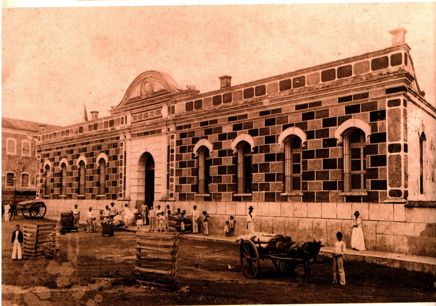
Fábrica Cânhamo, em São Luís - Do álbum Maranhão 1908, de Gaudêncio Cunha.