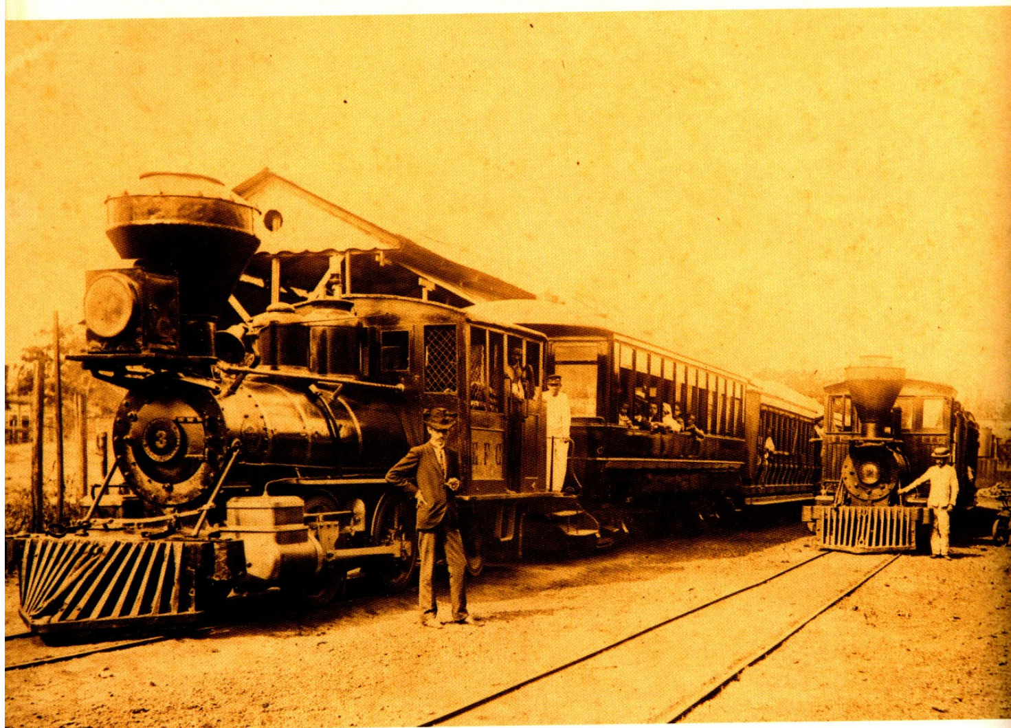
Estação suburbana em São Luís – Do álbum Maranhão 1908, de Gaudêncio Cunha.