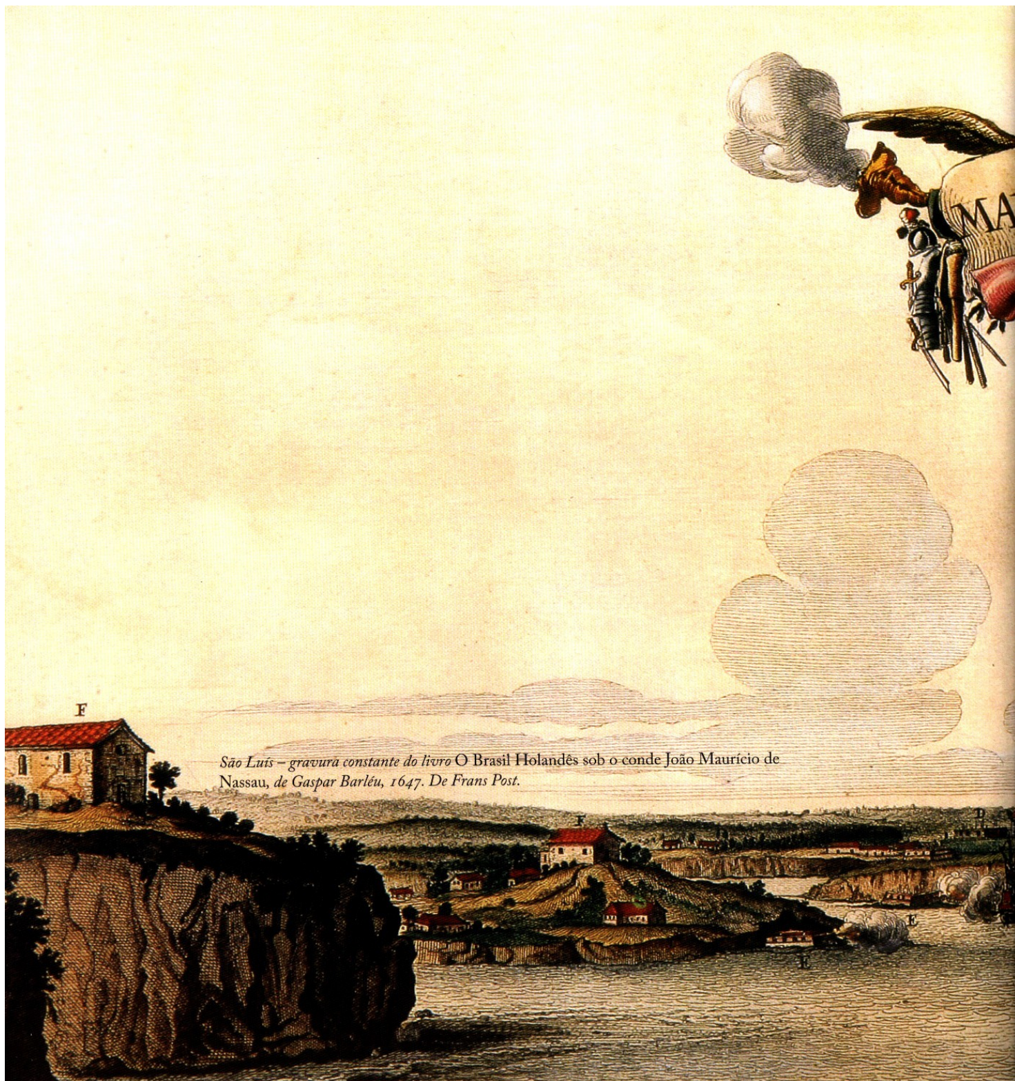
São Luís – gravura constante do livro O Brasil Holandês sob o conde João Maurício de Nassau, de Gaspar Barléu, 1647. De Frans Post.