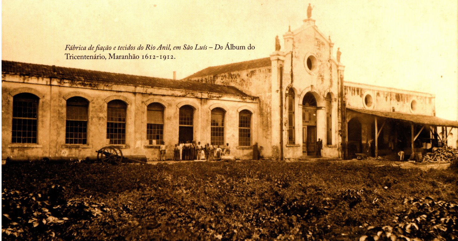
Fábrica de fiação e tecidos do Rio Anil, em São Luís – Do Álbum do Tricentenário, Maranhão 1612-1912.