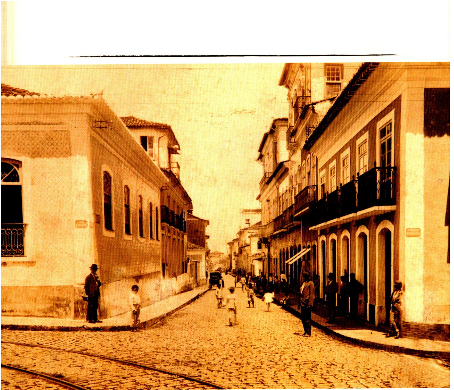
Rua Afonso Pena – Do álbum Maranhão 1908, de Gaudêncio Cunha.