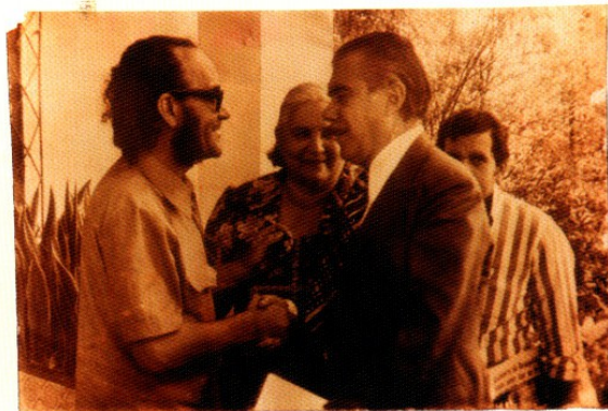
Bandeira Tribuzi e José Sarney, observados por d. Kiola, mãe de Sarney, nas festividades dos 50 anos do economista e poeta

1986 – Publicação de Poesia reunida , 1º volume, contendo o mesmo material de Poesias completas , exceto pela ausência de “Guerra e Paz” e Outros poemas .