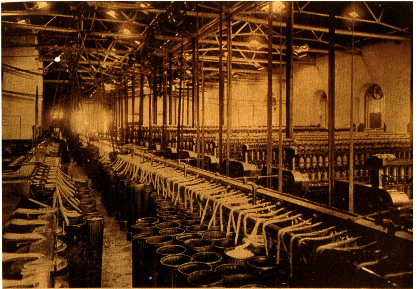
Fabrica « S. Luiz » — A fiação