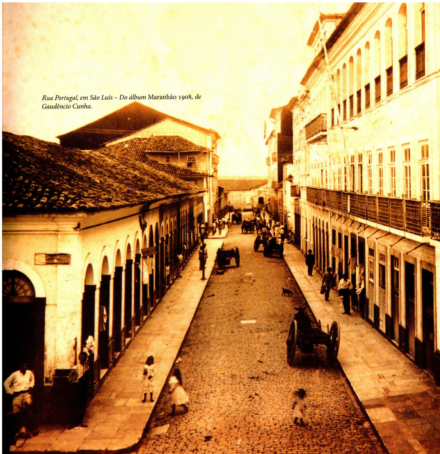
Rua Portugal, em São Luís – Do álbum Maranhão 1908, de Gaudêncio Cunha.