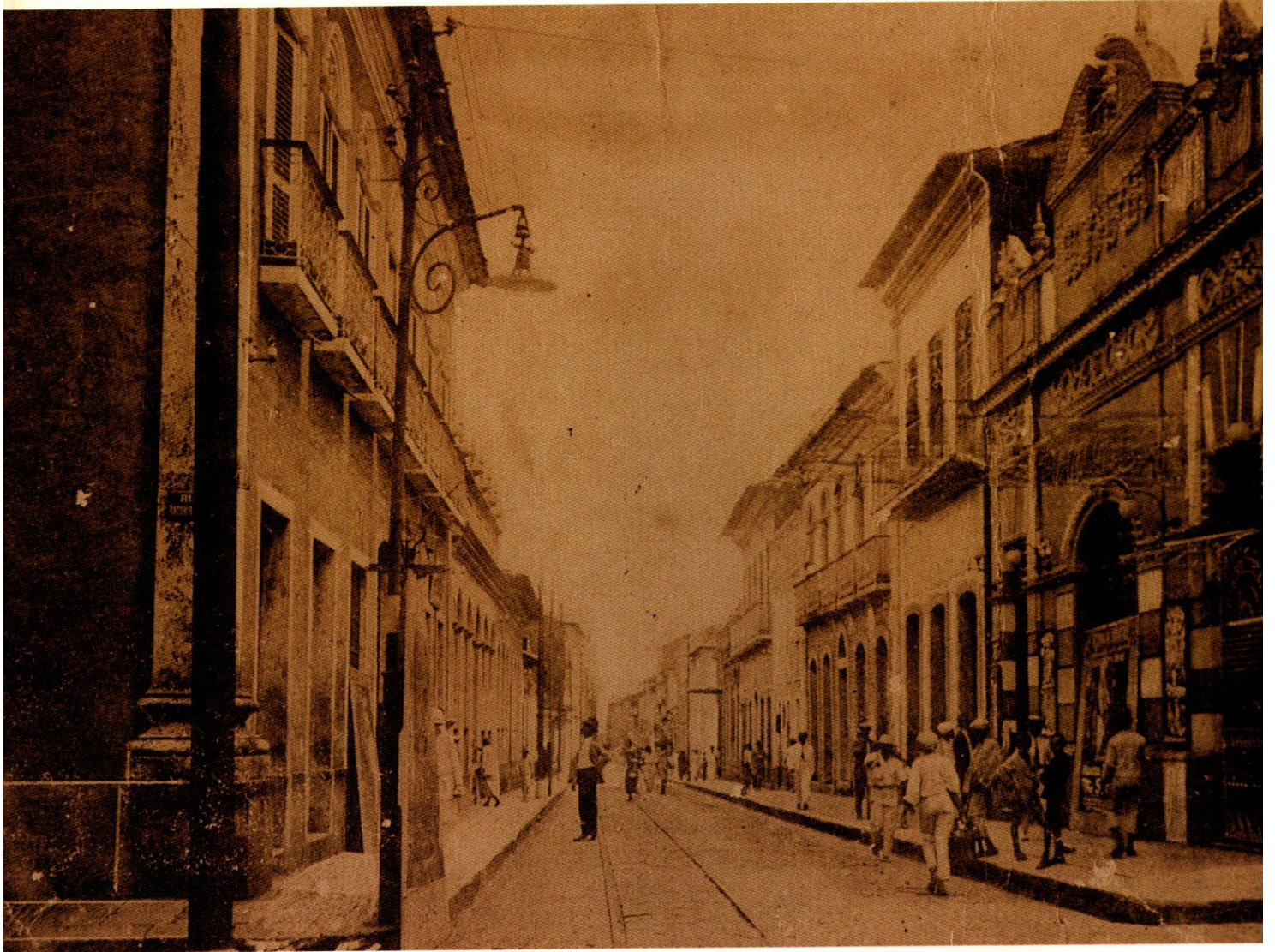
Maranhão trecho da Rua Oswaldo Cruz.