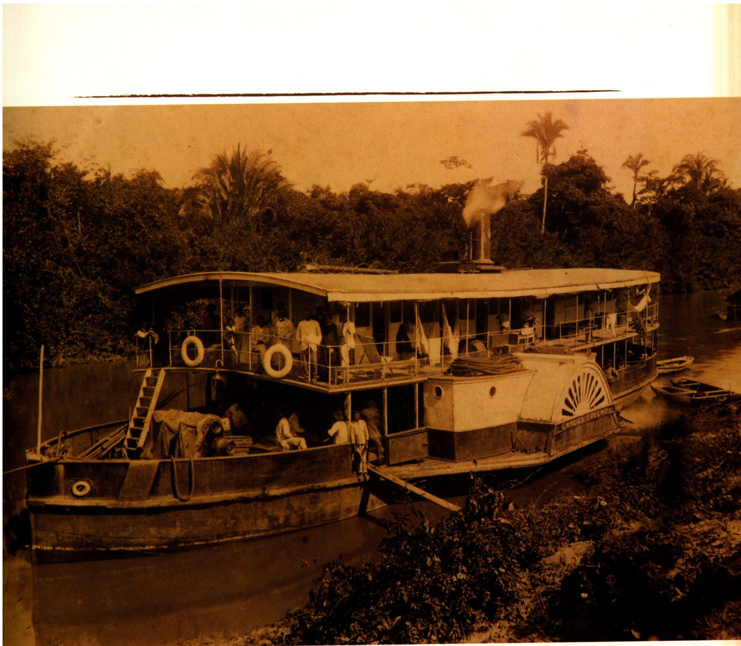
Vapor da Navegação Fluvial – Do álbum Maranhão 1908, de Gaudêncio Cunha.