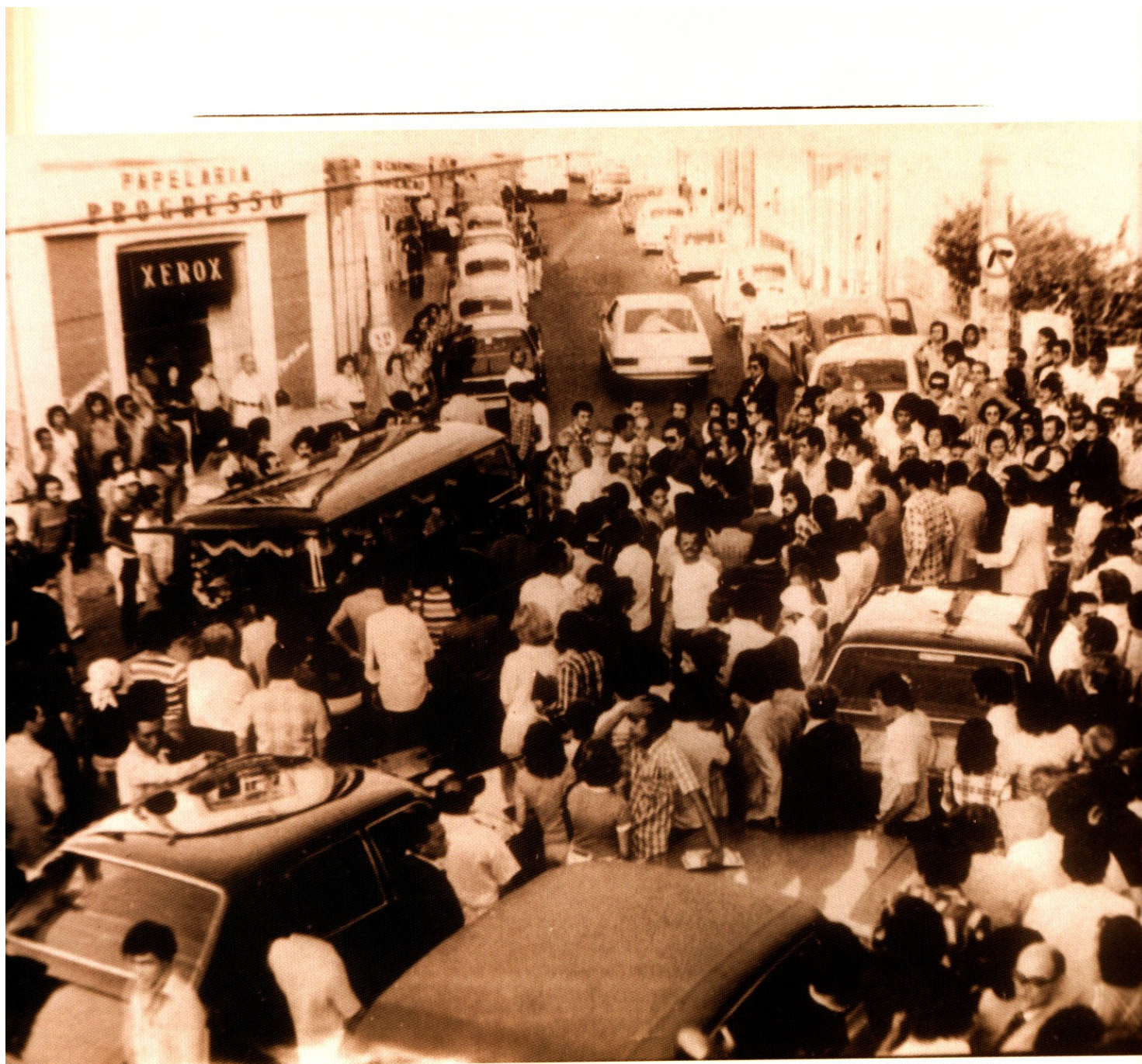
Cortejo fúnebre de Bandeira Tribuzi no dia 8 de setembro de 1977