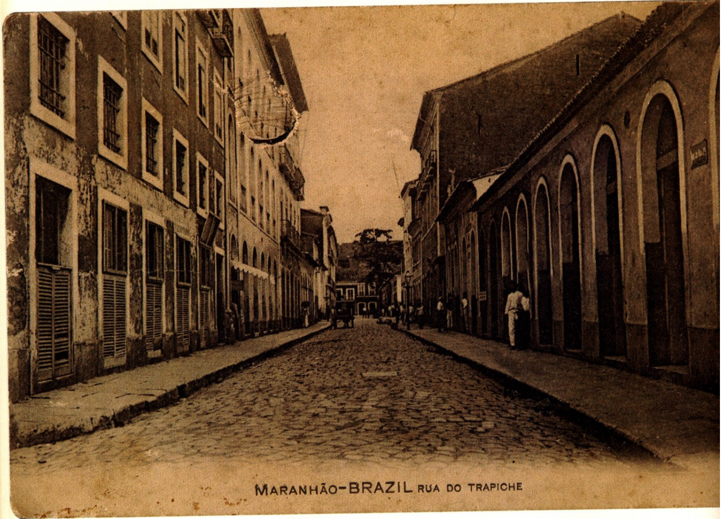
MARANHÃO-BRAZIL RUA DO TRAPICHE